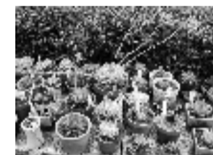
花坛边放满了多肉植物