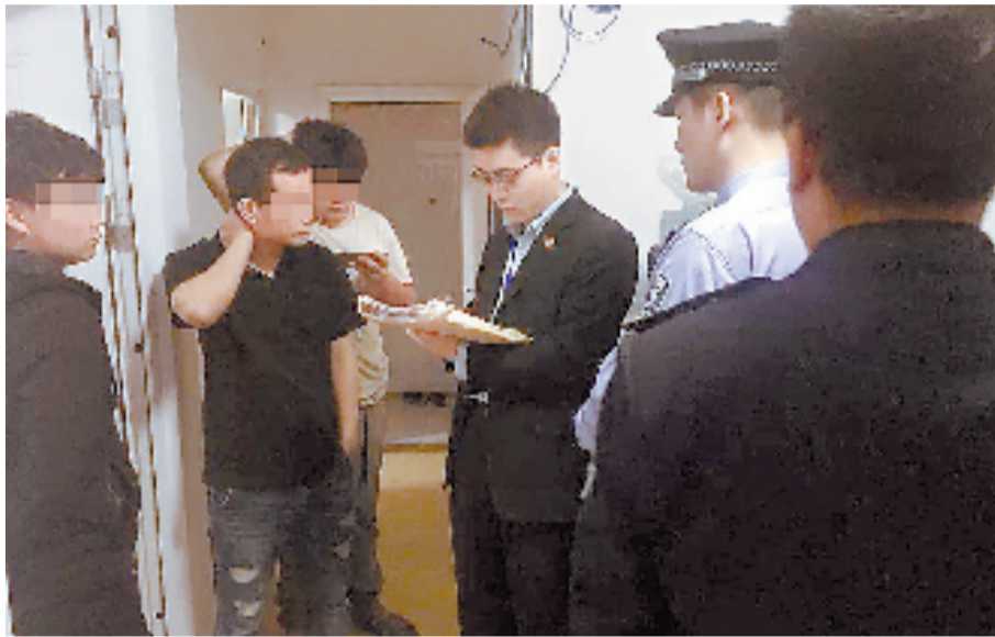
执行法官向租客耐心讲解相关法律条文。

一直以来,房屋腾退都是法院执行案件中最难啃的骨头。为了破解这一难题,根据杭州法院开展“集中腾退,助力金融”执行专项行动部署,近日,开发区法院对两起案件中涉案的抵押房产实施了司法强制腾退。