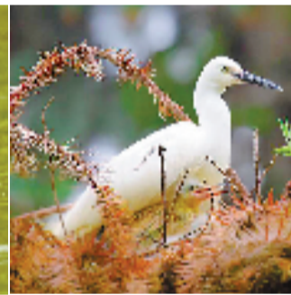
小斑嘴鸭,小黑水鸡和白鹭宝宝。