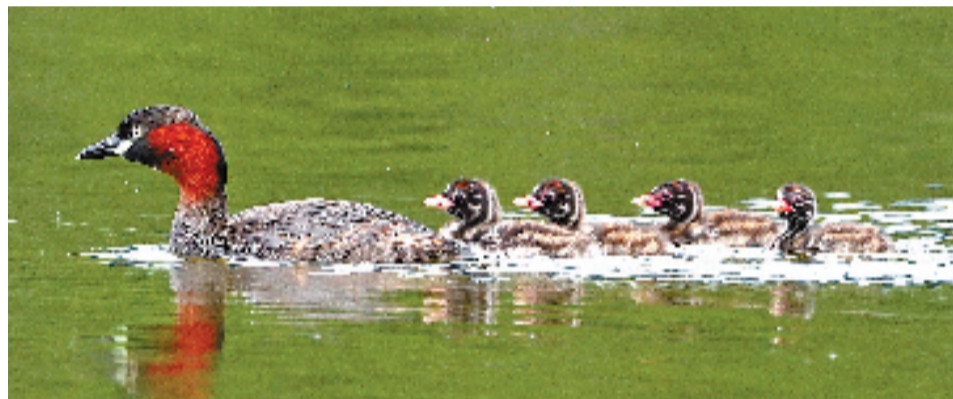
刚学会游泳的小鸕鷀宝宝。

清晨的西湖,小斑嘴鸭们集体出来遛弯,茅家埠的小鸕鷀(pìtī),也慢慢长大了,父母们忙着觅食喂养他们,有时候为了抢夺小鱼,爸爸们还要打起来,也是够拼的。黑水鸡宝宝,也学着大人游泳的样子,到处玩耍。可是,唯独少了鸳鸯宝宝,杭州鸳鸯护卫队的“白云”接连三年观察鸳鸯出生,昨天早上5点半又去西湖边巡逻了一圈。“往年荷叶出水面时小鸳鸯就出生了,奇怪的是今年一只也没看到。” 本报记者 陈艳