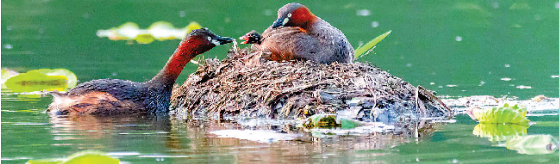
小鸕鷀宝宝又饱食一餐。