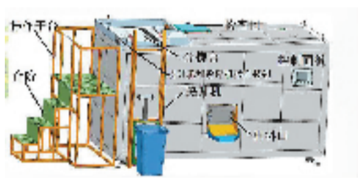
有机垃圾微生物处理机结构示意图

美丽中国,美好生活。浙江华庆元生物科技有限公司以自己独有的高效复合微生物制剂,为您提供简单、环保、经济、高效而稳定的微生物处理方案及产品,竭诚为各类有需求的单位提供优质的服务。