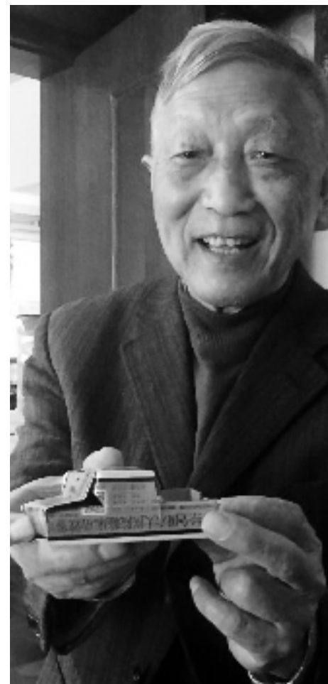
罗老和他原创的手工作品。