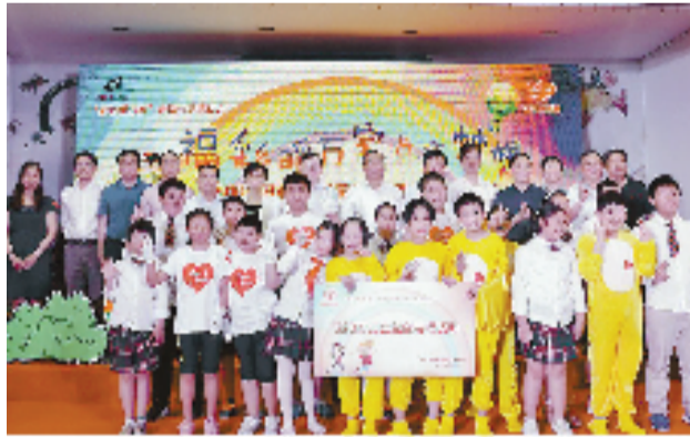
2017年5月27日,“福彩暖万家·点亮梦想”——困难少年儿童专项资助活动在杭州市下城区健康实验学校启动。

《报告》首次引用二维码延伸阅读,读者可通过手机扫码详细了解相关项目开展及经费使用情况。