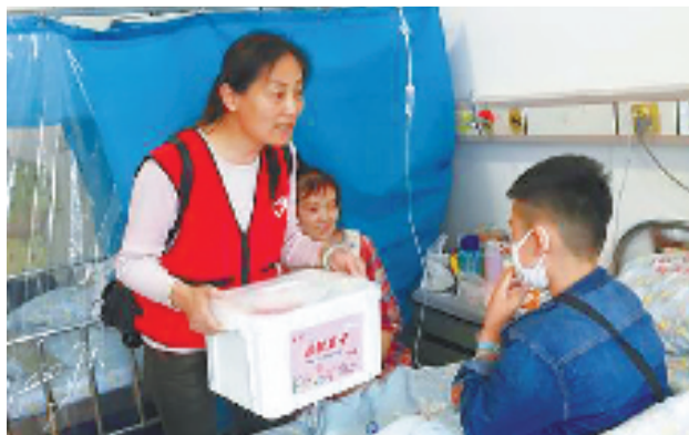
福彩志愿者为白血病儿童家庭赠送“温暖盒子”。