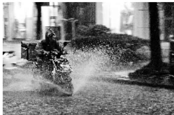
昨天下午,杭州出现短时大到暴雨、雷雨大风和强雷电。