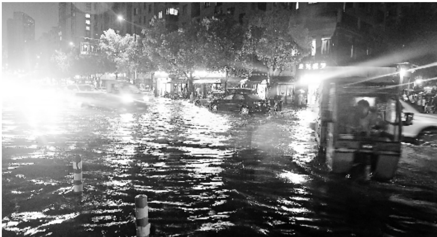
杭州余杭区临平北沙西路一带积水严重,许多车子熄火在路上。