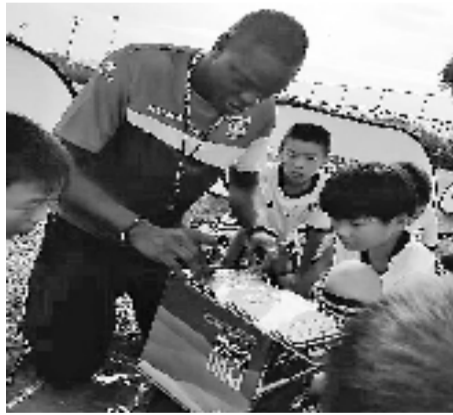
老莫在孩子们分析战术