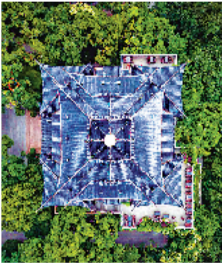
航拍视角,感受建筑的美感。