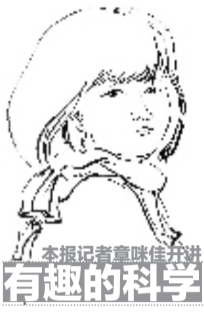
本报记者章咪佳开讲 有趣的科学