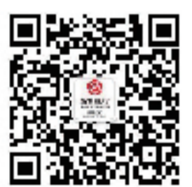
南京银行杭州分行