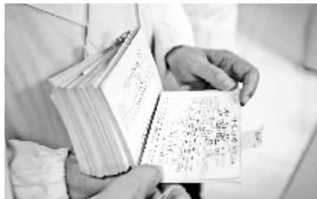
资料详尽的随访卡。