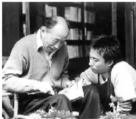
朱旭与黄磊出演《似水年华》

1995年,朱旭主演了吴天明导演的电影《变脸》,饰演一位一身绝技的传统老艺人——“变脸王”。这部电影拿到了“金鸡