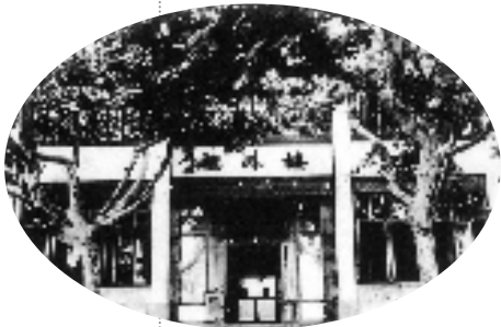
上世纪70年代的楼外楼