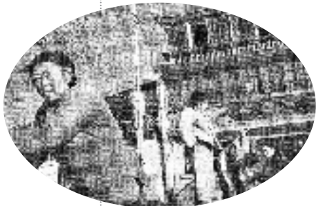
上世纪50年代的楼外楼