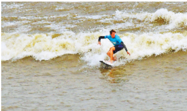
冲浪选手时不时在潮头作出精彩动作。