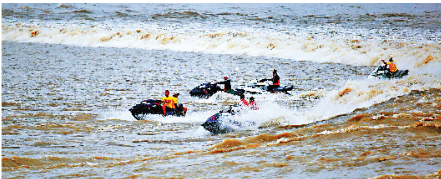
来自世界各地的冲浪好手乘坐摩托艇,乘风破浪,迎接大潮。