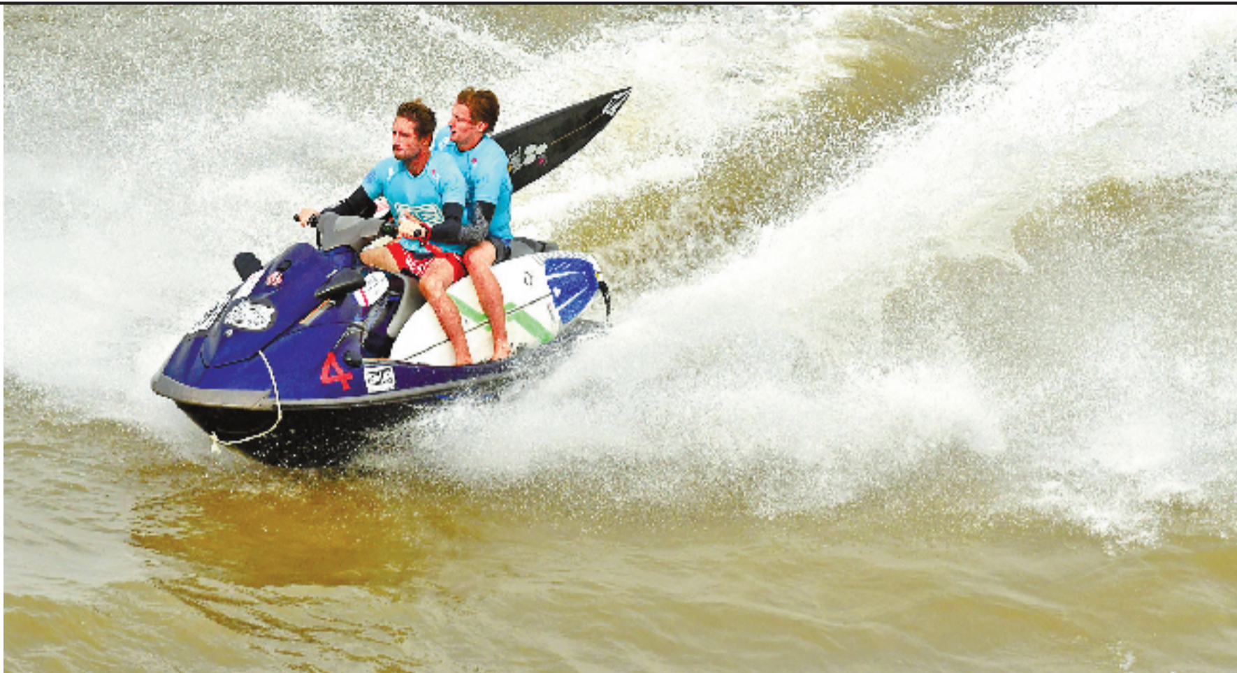
冲浪选手坐在摩托艇上,随时准备下水。