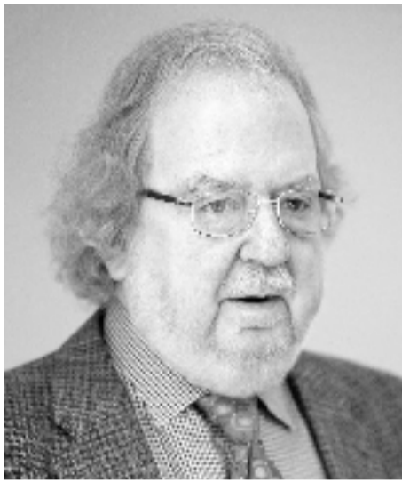
左图:詹姆斯·艾利森

诺贝尔委员会在官网称:“今年的获奖者展示了抑制免疫调节的不同策略是如何应用于癌症治疗的。他们的发现是我们与癌症斗争的一个里程碑。”