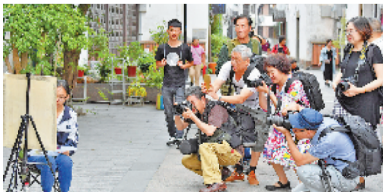
采风活动中,摄影爱好者在创作。