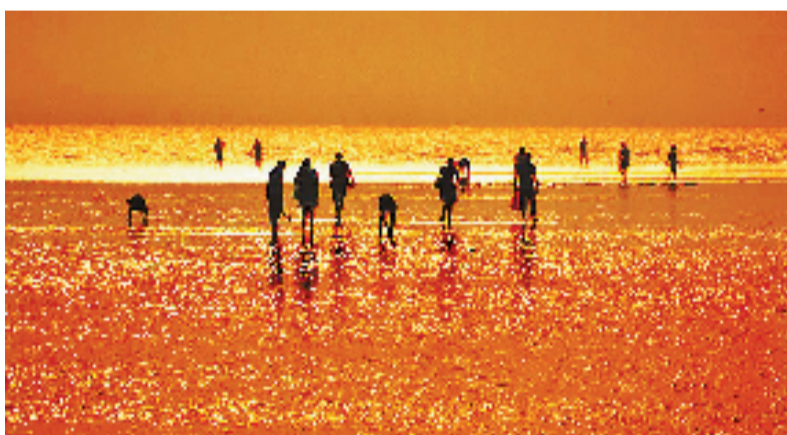
启东黄金海滩。