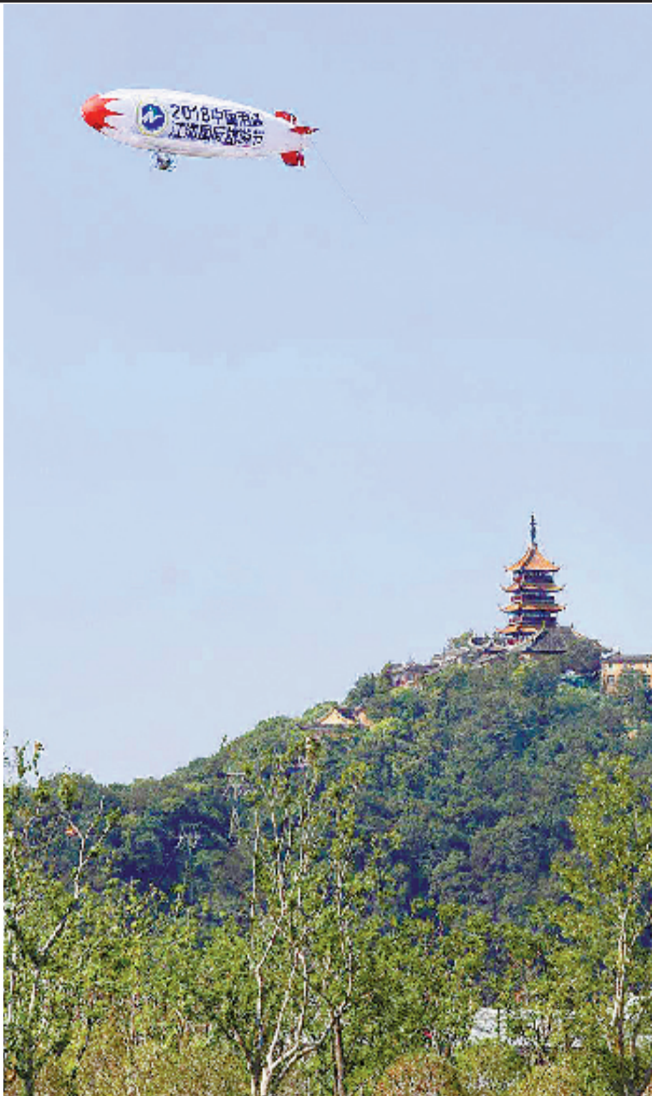
南通江海国际旅游节飞艇航拍。