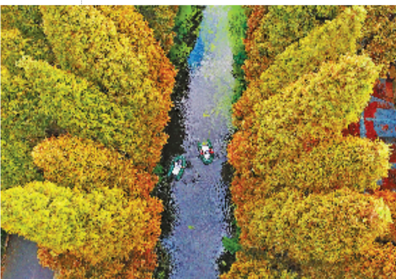
如皋金岛生态园。