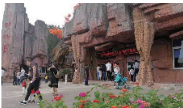
据浙江新闻客户端 通讯员 马晓芬 陈一鸣

如今的国庆长假,邀朋携友去“仙山胜水 浙中花都”婺城休闲旅游,已经成为周边县市游客的首选。青山绿水间看白墙黛瓦,蓝天白云下赏亭台楼阁,放飞思绪,愉悦身心,不啻为一大乐事。记者从婺城区旅游局了解到,今年“十一”黄金周,婺城区接待游客33.01万人次,旅游总收入3.02亿元,均增长44.04%。乡村游、自助游、自驾游等丰富的旅游业态与文明和谐旅游氛围,正是婺城旅游市场持续火爆的原因。