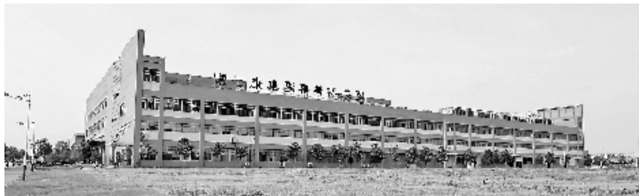
富士康集团 嘉善科技园