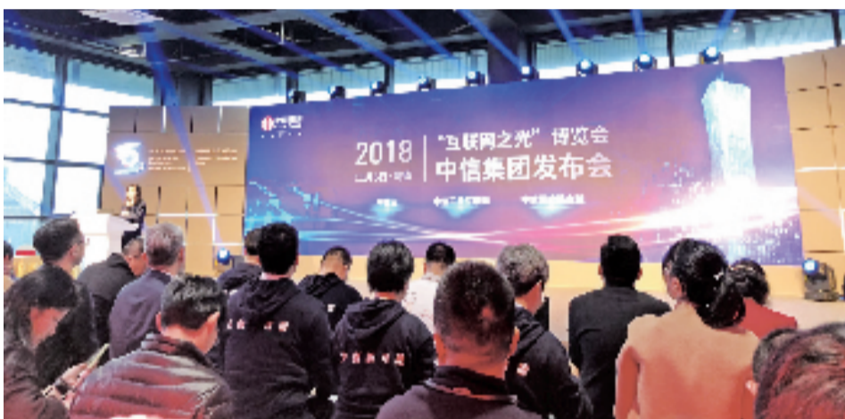
“互联网之光”博览会中信集团发布会。

中信银行是国内最早开办出国金融业务的商业银行,已覆盖跨境结算类、外汇类、外币理财类、融资类、资信证明类、全球资产配置等七大类出国金融产品。在本届互联网大会上首次发布的出国金融服务平台“环球一