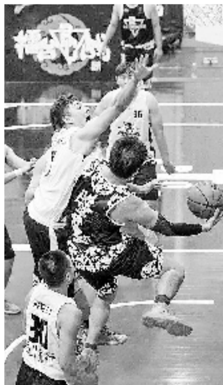
入选15强的門門篮球赛。