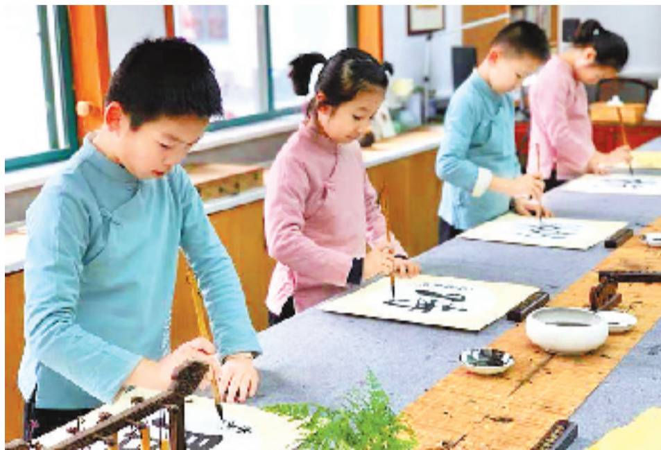
杭州市永天实验小学四位书法社团的小伙伴,每人写一个字,一起组成了“杭州时间”。

“杭州时间”将是一组持续四年的特别报道,因此,这场书写征集也将持续四年,我们的刊头,等待大家的手笔!