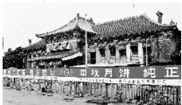
1999 年 9 月的老杭州火车站。