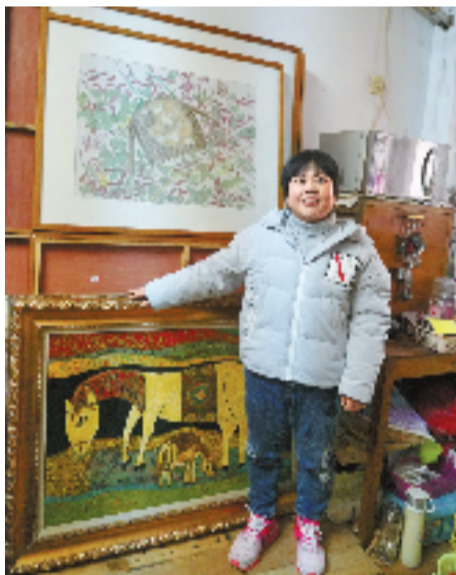
她的作品,小屋已放不下