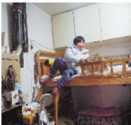
上铺的柜子里,装满了她的获奖证书。