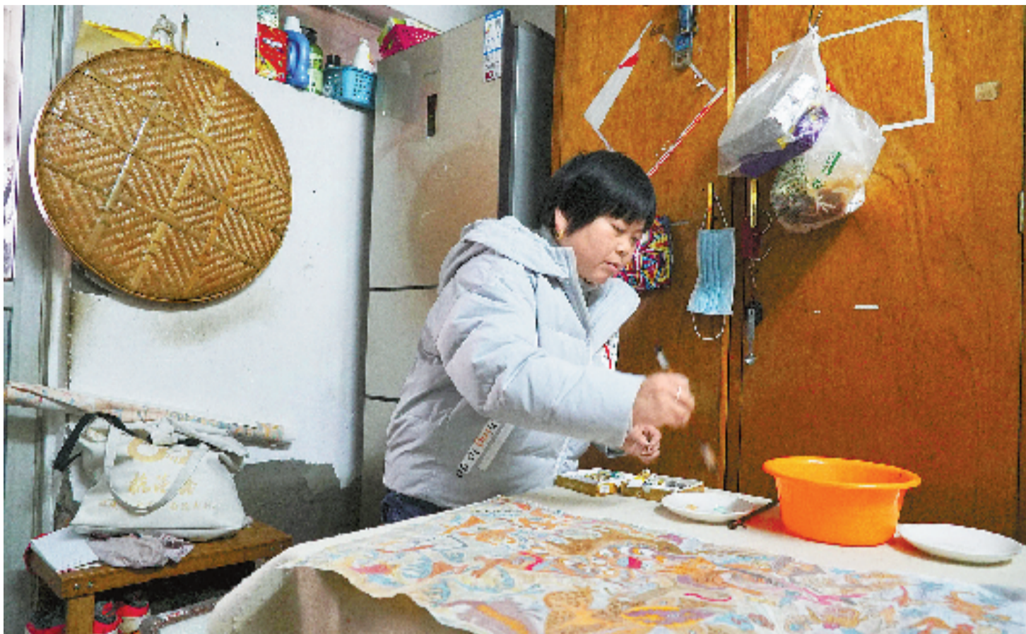
在狭小的屋子里,坚持作画。