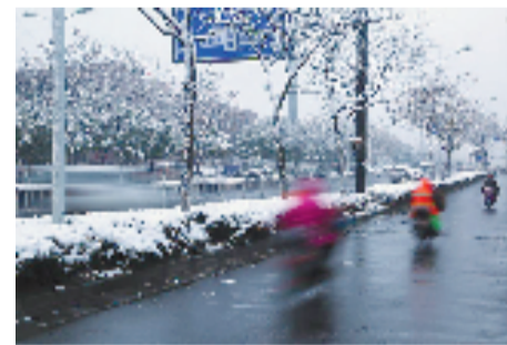
2018年最后一场雪(12月31日),路上骑车人行色匆匆