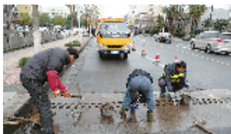
1月10日,阴雨天,市政管理工作人员在新塘街道蓝天桥上清除污垢杂物,有利流水畅通,确保冬季行人、车辆安全