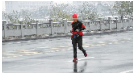
12月31日,萧山下雪晨炼人