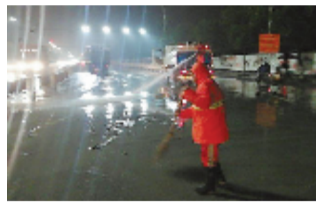
1月9日晚上,冰冷的冬雨在不停地下,趁着黎明前路上车少,区环卫工作人员在抓紧时间清扫建设四路农都附近的土渣