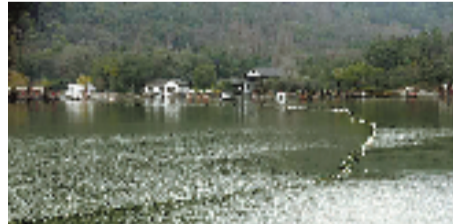
1月16日,天气初晴,期盼已久的湘湖年鱼终于可以拉网开捕了。