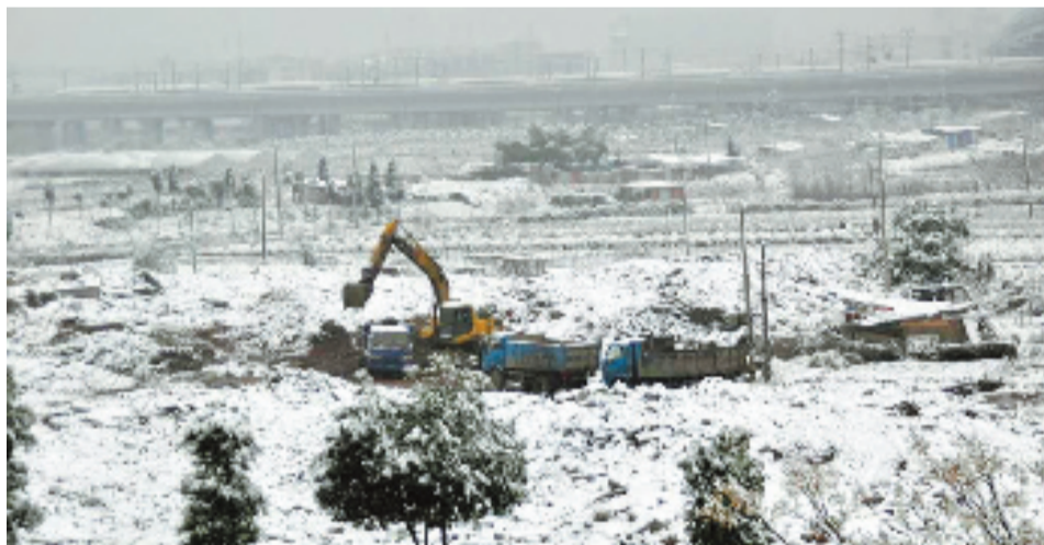
12月31日,新塘街道油树下村在雪天清运拆迁杂物