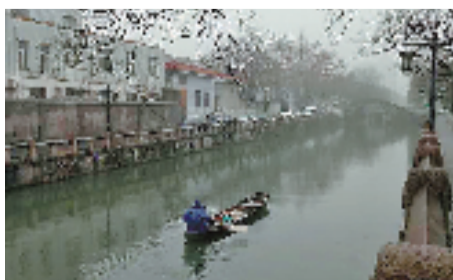
1月4日,为保障河道清洁,城厢街道城河,保洁员雨天在清理垃圾