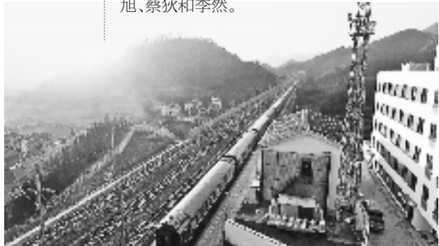
浙江省最西面的火车站——杨林站。

负责这段线路日常维护的就是中国铁路上海局集团有限公司杭州工务段常山高铁线桥车间开化高铁线路工区杨林值守点的姚旭、蔡狄和李然。