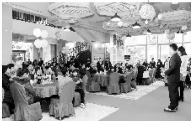
儿福院年夜饭现场。

好,就是说话听不懂。她还不知道,新家里有一个16岁的哥哥和一个5岁的妹妹,她的年纪在他们中间。