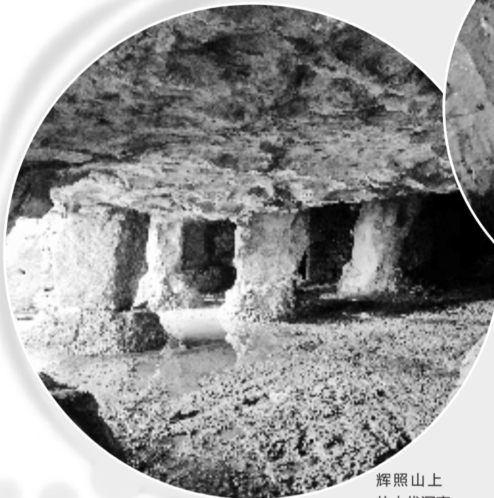
辉照山上的古代石窟。