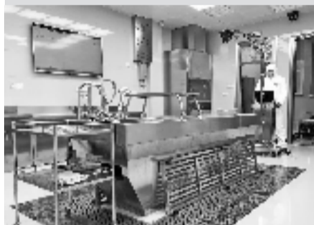
按照检验高度腐败尸体标准建设的不锈钢材质的解剖台。