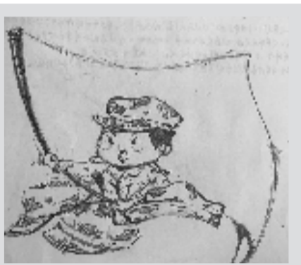
这幅作品画的是Q版军人,旨在表达“军人是最可爱的人”。