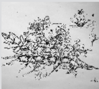
这张画的是祖国的花朵,寓意各民族团结。