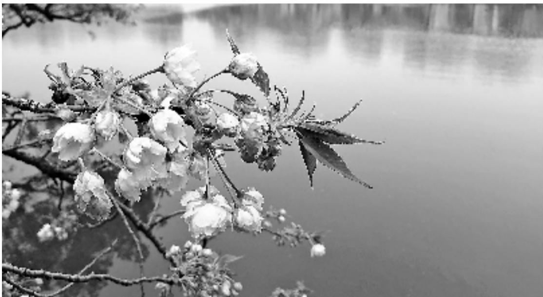
绿樱花开,分外妖娆。

4月的大门开启,这是一年中气温回升最快的一个月。虽然暖湿气流掌握主控权,但暖区天气系统不稳定。晴雨转换更快,气温跌宕起伏。雷暴日将增多。