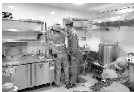
工作人员在进行“瓶改管”施工。