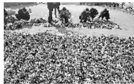
图为被盗挖的兰花草。