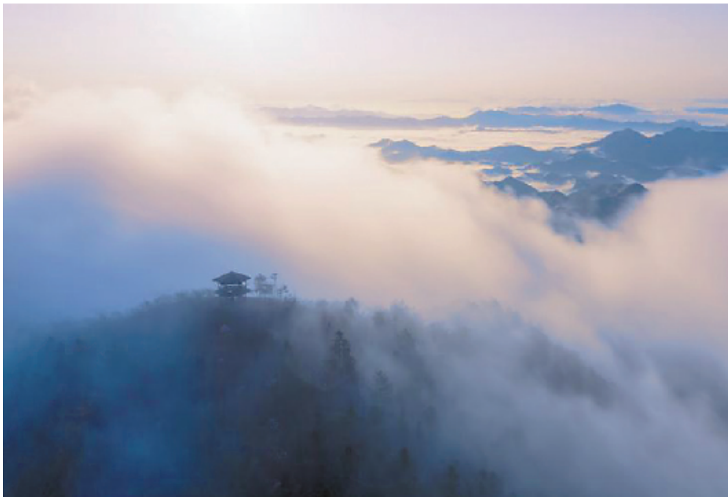
风拂过林,翻起了雾,隐约透着几间世俗却空无一物。浮光半生,看到远方才能抵御庸常。