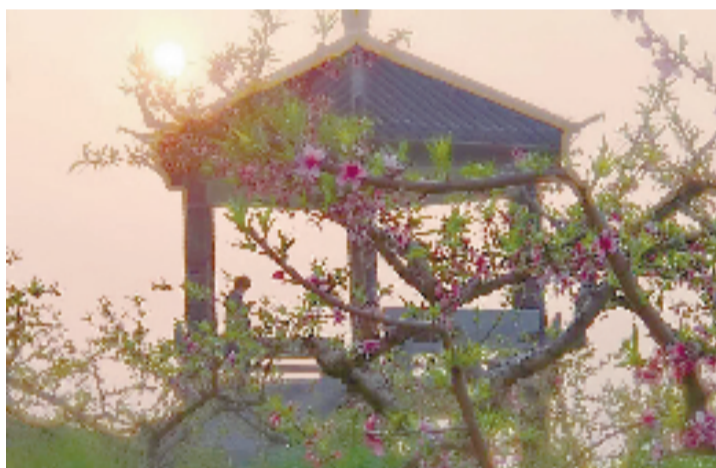
夕阳西下,暮阳人犹在天涯,信步而过,划过的风景,够得到的桃花香,春天来了。