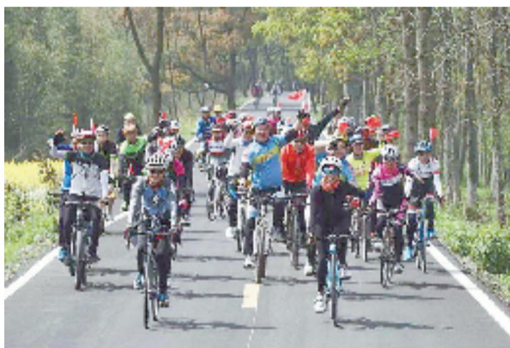
生命的意义,就是以不断出发的姿势获得重生,为某些只有自己才能感知的来自内心的召唤。走在路上,无法停息。