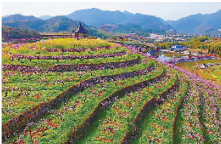
一夜风来,万树花开,尤忆当年,执旗守坛一百二十汉,唯念东风。