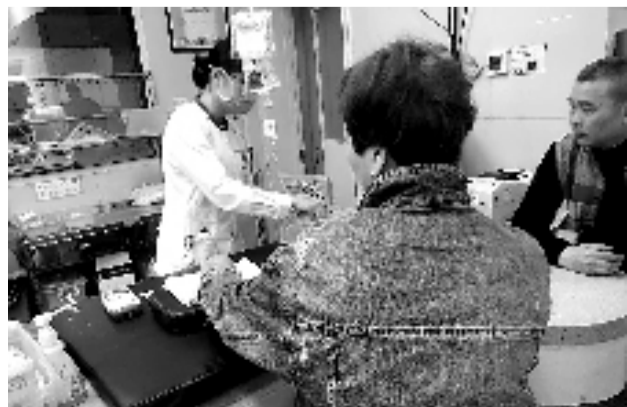
唐大姐在接受治疗。