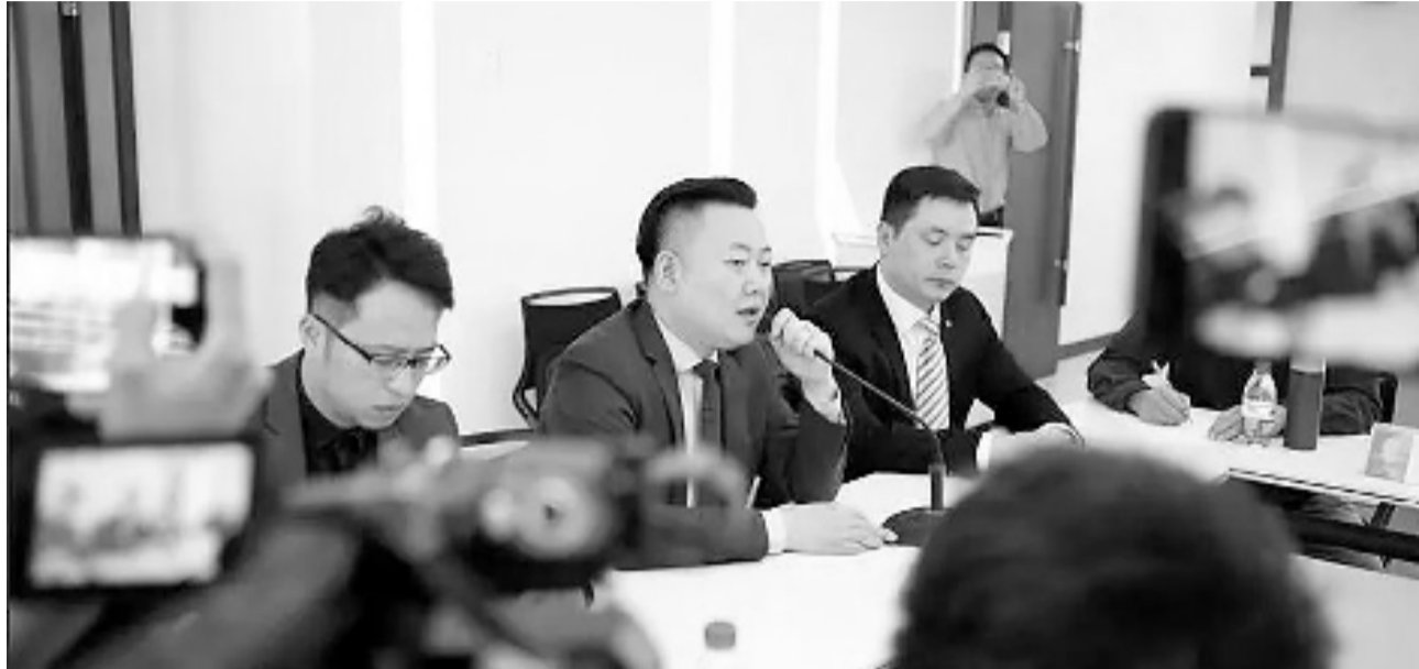
消保委调解会现场

而就在昨天,杭州市消保委进行了一场公开调解会,当事人双方是消费者和4S店。消费者发现自己当新车买来的奔驰车竟然早在买车前一年就出过险,要求全款退车,4S店则认为当初告知过消费者,所以只愿意承担部分损失。