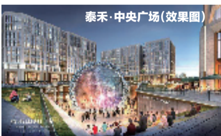
泰禾·中央广场(效果图)