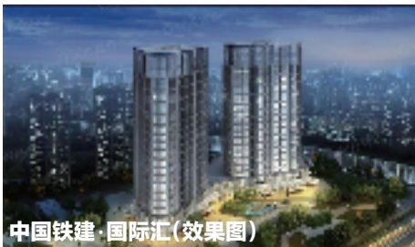
中国铁建·国际汇(效果图)