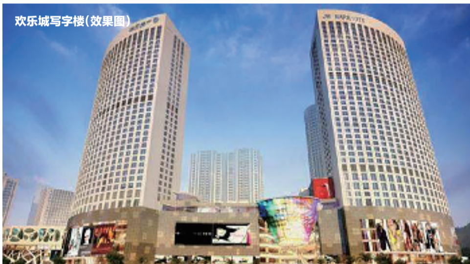
欢乐城写字楼(效果图)