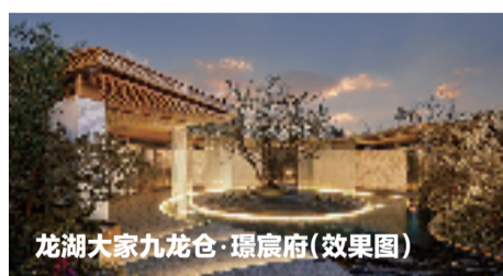
龙湖大家九龙仓·璟宸府(效果图)