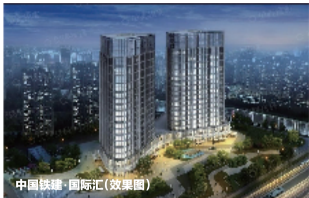
中国铁建·国际汇(效果图)