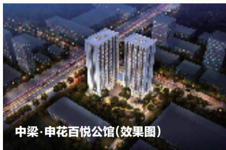
中梁·申花百悦公馆(效果图)