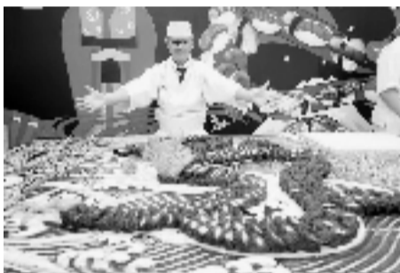
日本厨师榊明生现场制作九龙壁寿司

择奶茶口味、冰度以及糖度。完成付款后,制茶机械臂便开始自动调配奶茶,再将奶茶放至取餐柜,全程无需人工参与。