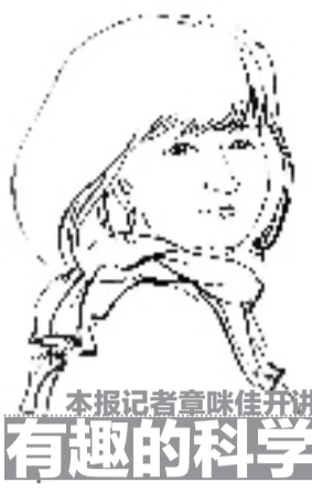
本报记者章咪佳开讲 有趣的科学