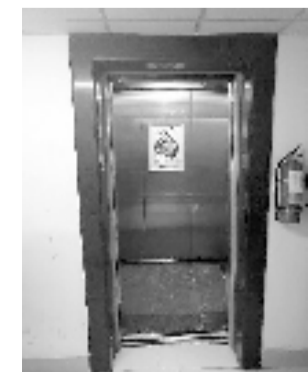
时常关人的金桂轩电梯。

为什么金梅轩和金兰轩的电梯可以更换,金桂轩却还没消息呢?连日来,钱江晚报记者进行了走访调查。