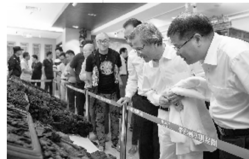
嘉宾现场观看展览。

本报讯 昨天,“第四届以画说话·美术新青年作品展暨纯心艺术藏馆开馆仪式”在浙江省东阳市隆重举行。