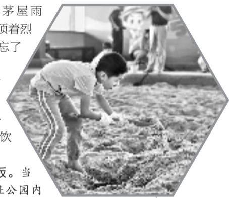
小朋友在体验考古。

②关于方便。园内参观途中难免遇到“三急”。在参观中,钱报记者发现,当前除了几个大型场馆配备了洗手间外,其他站点的洗手间数量相对较少。好在园方也考虑到了现状,如果真的急着上洗手间,可以在候车点附近找找,一般会有移动式的简易厕所。