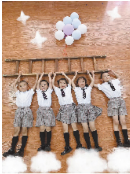
《飞向更高的蓝天》淳安县实验幼儿园