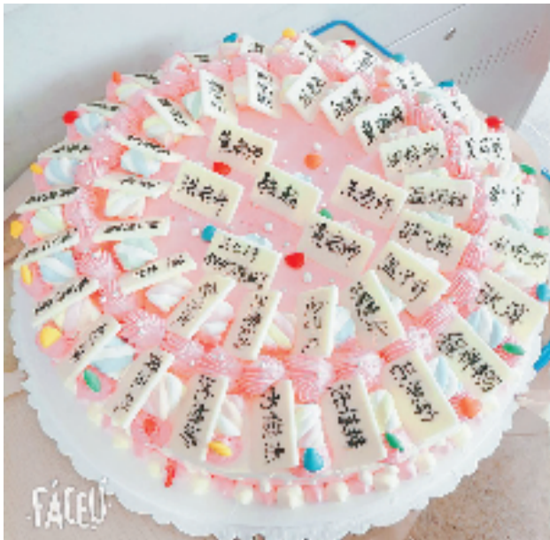
淳安县千岛湖镇第一小学六4班