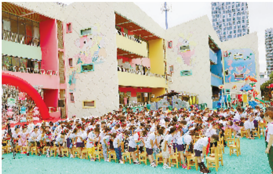
《感谢师恩》淳安县实验幼儿园