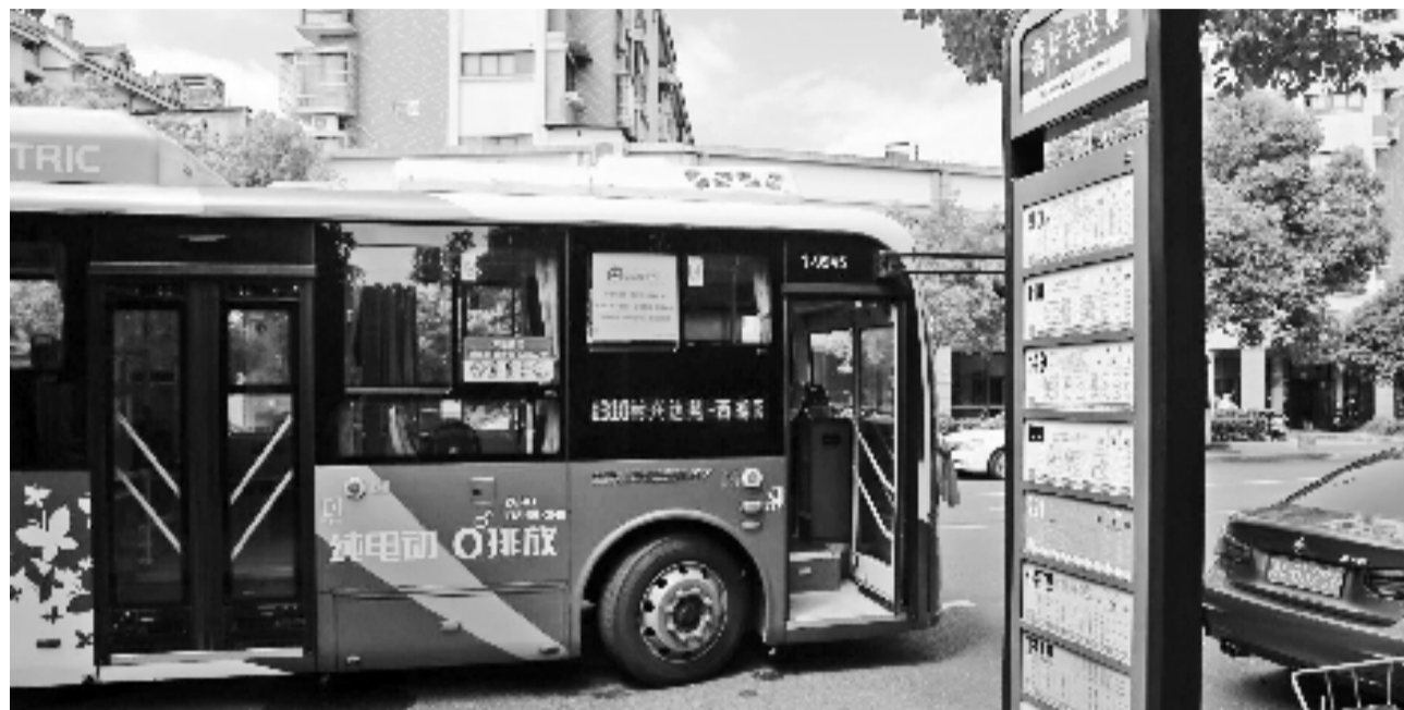
杭州首条穿梭巴士。

1310路最大的特点就是灵活，除了固定公交站点外，沿线设置了8个“穿梭巴士招呼站”。你可以在招呼站内招手上车，并在车内按铃下车。