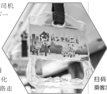
扫码可加入乘客沟通群。