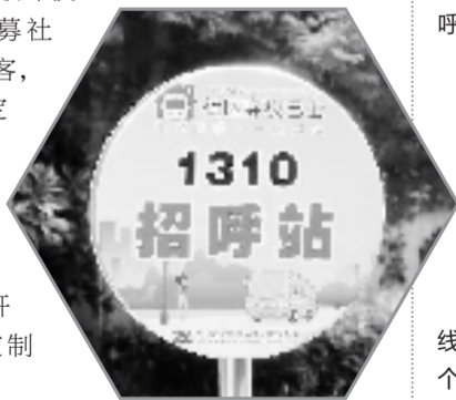
1310路沿线设置了8个招呼站。