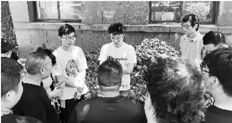
“乐伽公寓”总部来人(后排中间),被房东和租客团团围住。

昨天,是“乐伽公寓”承诺给大家一个回应和解决方案的日子。“乐伽公寓”在回应时表示,资金方面确实有困难,总部与几个投资方正在洽谈杭州方面业务的收购事宜,希望大家给一点时间。