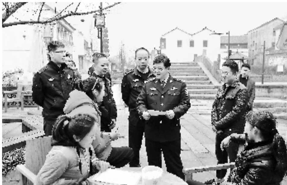
湖州市公安局长夏文星(居中戴眼镜者)走访基层。