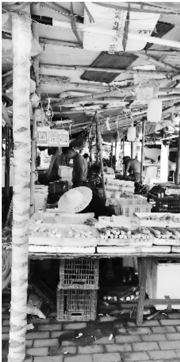
菜场的环境简陋,靠性价比走红