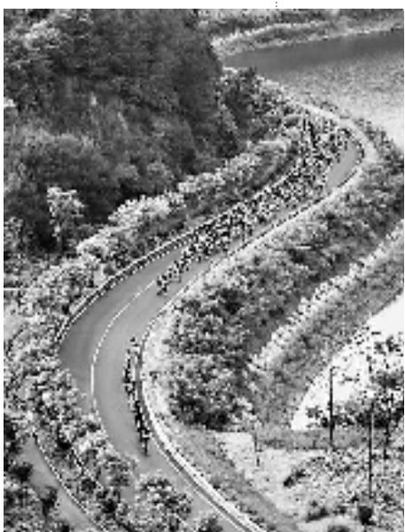
骑行淳杨公路。