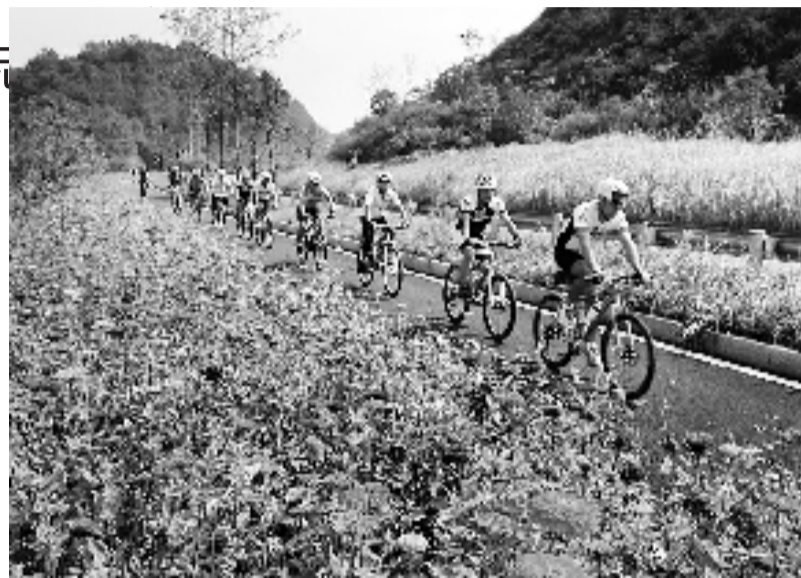
左图:骑行淳杨公路。