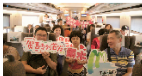
丽水高铁旅游专列首发仪式

日,每天都有精彩内容呈现,其中包括启动仪式、丽水花车巡游宣传展示、“丽水山耕”品牌会客厅暨新闻媒体见面会、“丽水山耕”品牌及各县(市、区)农文旅展示活动、各国驻上海总领馆官员推介会、“丽水山耕”农产品博览会、丽水籍在沪大学生座谈会、九县(市、区)农文旅营销团队进上海、上海携程丽水旅游主题店授牌仪式、长三角旅游集市丽水形象展示活动等。